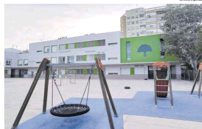
El patio de mayores es una de las nuevas instalaciones que forman el Colegio de Educación Especial Atades-San Martín de Porres.

El centro ofrece servicio de transporte escolar adaptado y comedor escolar con dietas específicas elaboradas en cocina propia. Cuenta además con piscina climatizada en sus instalaciones para aprendizaje y tera-